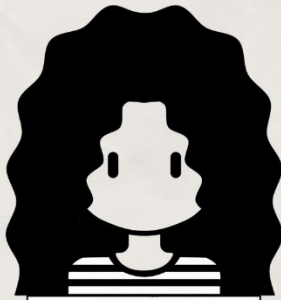
#1 RESI U. 6ti