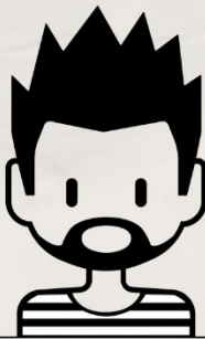
#5 JIMMY N. rB9