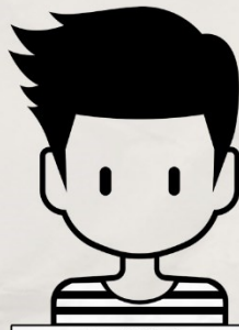
#2 KAJ L. X45